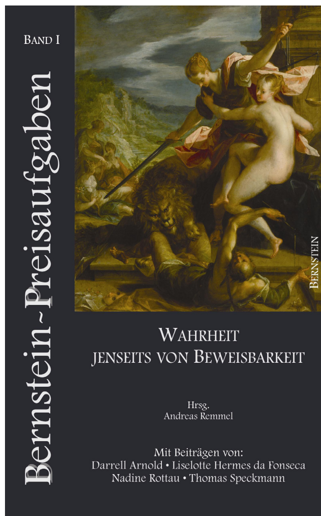
Cover-Abbildung