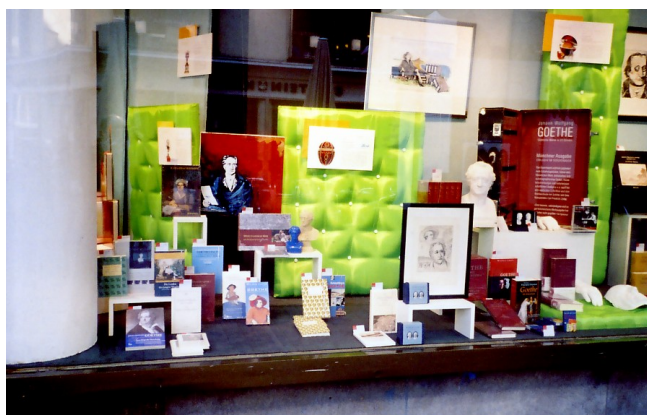
Die »Goethe-Sammlung-Bernstein« außer Haus.

Die »Goethe-Sammlung-Bernstein« soll keine von der Außenwelt abgeschottete Verleger-Kollektion sein bzw. werden, sondern – wann immer dies möglich ist – auch öffentlich gezeigt werden. So freut es uns sehr, dass die Bonner Buchhandlung Bouvier/Thalia Teile unserer Sammlung im Rahmen ihrer Schaufenstergestaltung anlässlich der 175. (in Worten: einhundertfünfundsechzigsten!) Wiederkehr von Goethes Todestag am 22. März 1832 ausgestellt hat. Unter dem Titel » Und Goethe hat es vorausgesagt ... Zum 175. Todestag neue Erkenntnisse und Arbeiten aus Bonn über den großen Dichter « berichtete die Bonner Rundschau in ihrer Ausgabe vom 24. März 2007 auf Seite 48 durch einen großen Artikel über die Arbeit des Verlags (siehe den Presse-Spiegel auf der Verlags-Homepage). Nachfolgend finden Sie eine optische Bestätigung des soeben Berichteten: