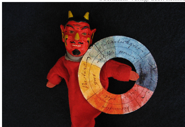
»Mephistofelische Farben«