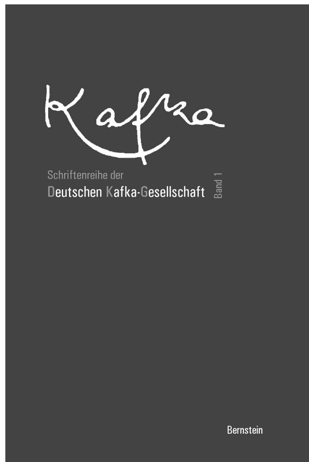
128 Seiten; € 24,80; ISBN 978-3-939431-04-6